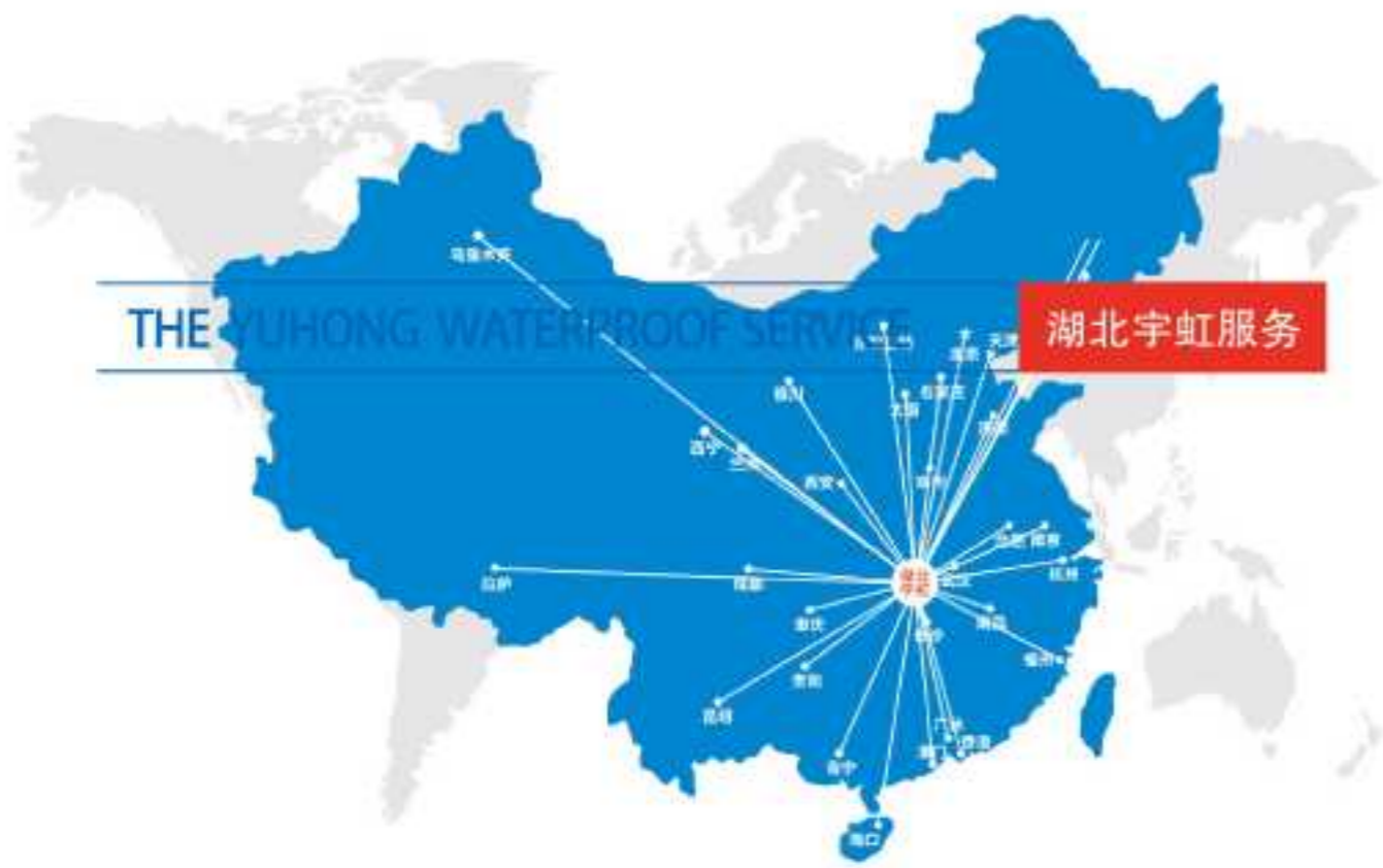
湖北宇虹防水禹升牌、荆鼎牌防水材料销售网络示意图