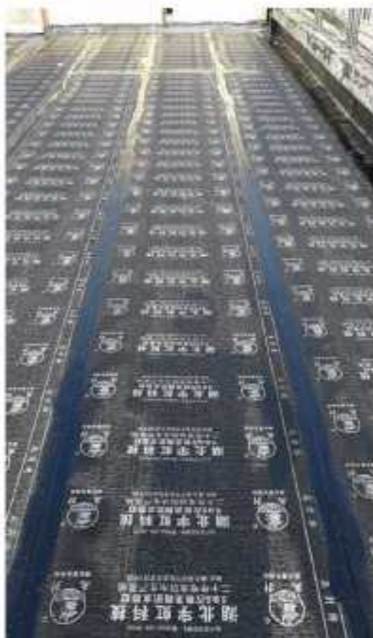
中国安居养老福利示范社区项目施工现场