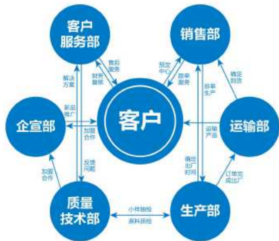
湖北宇虹防水以客户为中心一体化服务示意图