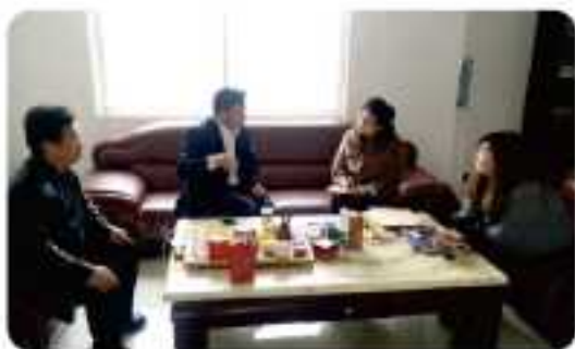
中国防水建筑报对董事长进行采访