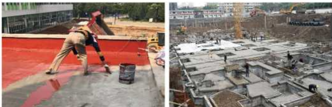
书香雅苑项目施工现场