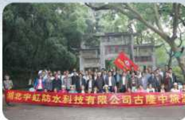
公司组织全体员工在古隆中旅游