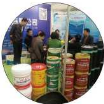
武汉国际绿色建筑技术产品博览会参展