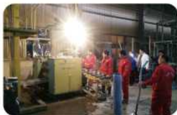
荆州电视台主持人聚头对生产线采访摄像