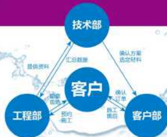
湖北宇虹防水工程服务体系及流程示意图