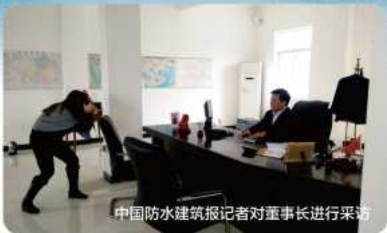
中国防水建筑记者对董事长进行采访

未来，湖北宇虹将立足国内，面向海外，走高品质国际化路线，致力于为广大客户提供高新、优质、环保的防水材料产品和完美细致服务。湖北宇虹，与您共建美好家园。