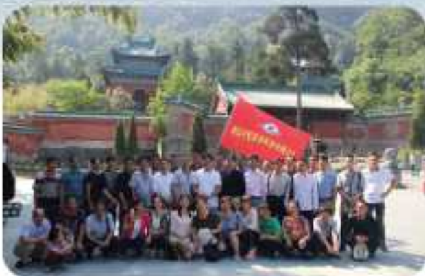
公司组织全体员工在武当山旅游