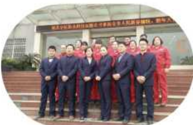
湖北宇虹在荆州电视台对全市人民的新春祝福